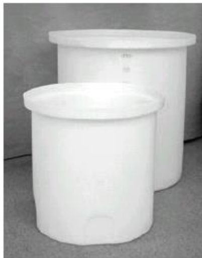
SAW 100/ SAW 200

K zajištění bezpečného skladování přípravků na ošetření vody. Všechny dávkovací a skladovací nádoby je nutno (ve smyslu zák. č. 258/2000 Sb) opatřit bezpečnostními záchytnými vanami, resp. jímkami.