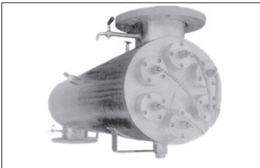
VARITEC UVE 120